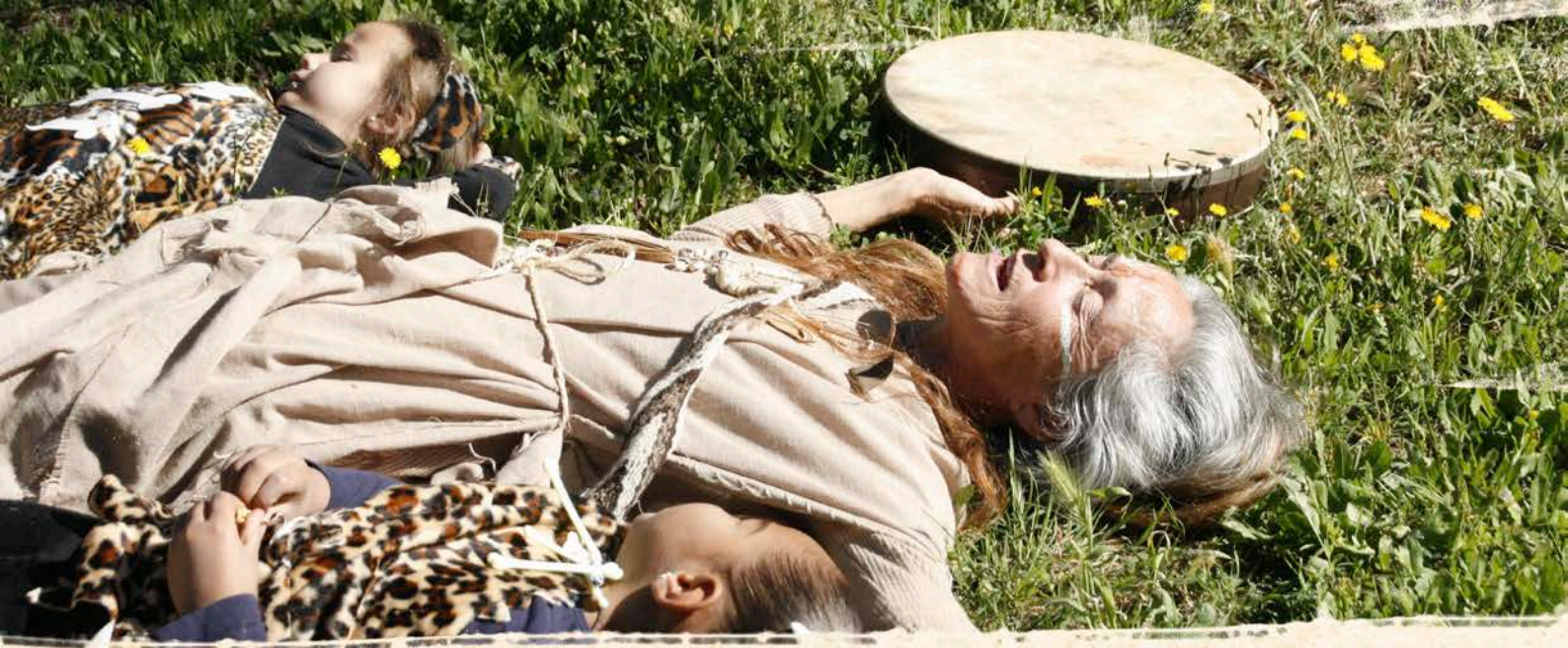
Yanuka favoreciendo el amor a la tierra