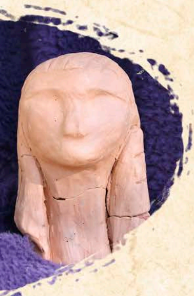
Rostro Brassempouy. 25.000 años. Marfil de mamut

Conectaremos con los momentos más importantes de la vida (nacimiento, ritos de paso, cosechas, uniones, muerte), la abundancia de la madre tierra, la renovación de los ciclos vitales y realizaremos ofrendas de agradecimiento. Rescataremos una misión que nos haga útiles a los demás y realizaremos la promesa del cuidado de la vida en todas sus manifestaciones.