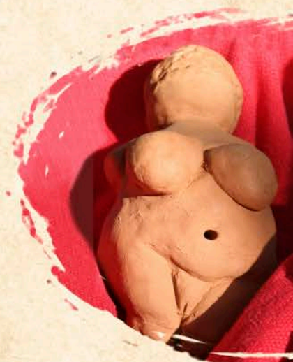
Estatuilla de Willendorf. 30.000 años. Piedra