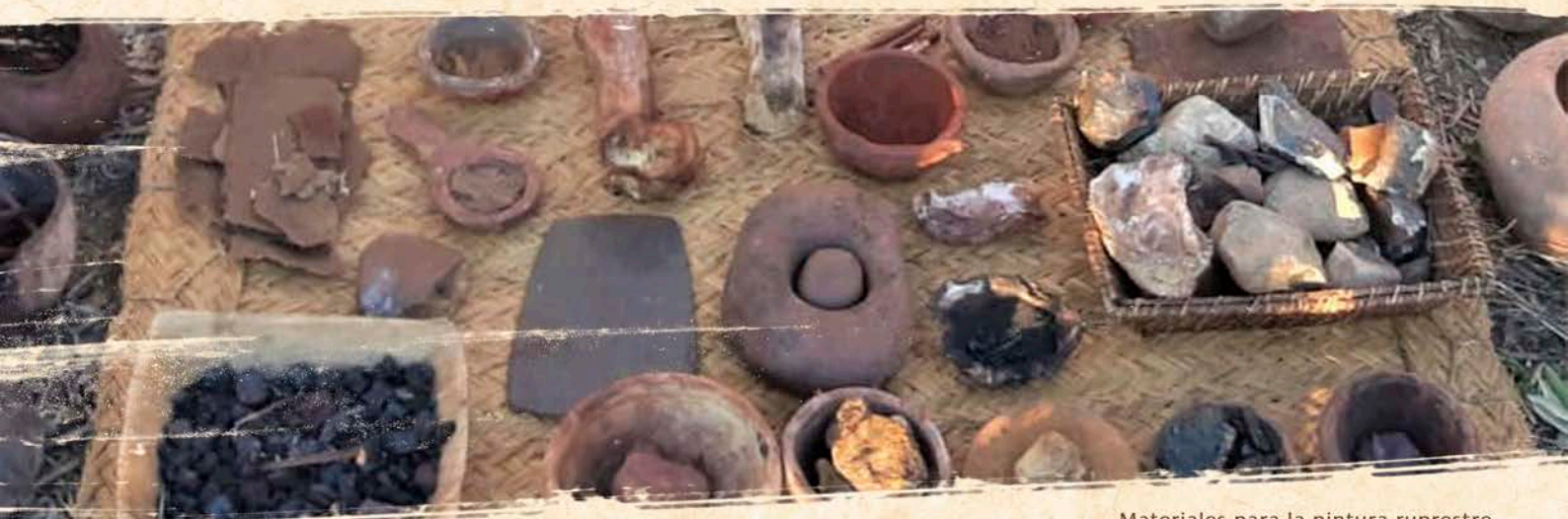
Materiales para la pintura rupestre

Inspirándonos como si entráramos a lo más profundo de las cavernas, donde el útero de la madre naturaleza gesta sus criaturas, los alumn@s realizarán reproducciones de pinturas rupestres sobre las grandes piedras de granito que descansan en la tierra. Usaremos la técnica de nuestros ancestros y pintaremos con pigmentos naturales (óxido de hierro, carbón) y la ayuda de plumas, palitos, muñequillas, etc. Ciervos, bisontes, soles, serpientes, figuras antropomorfas, manos negativas, que durante miles de años el ser humano estuvo recreando con gran maestría.