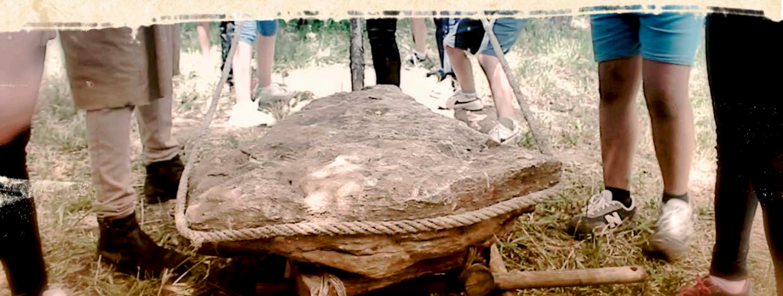
Visitantes moviendo piedra pesada

La provincia de Huelva cuenta con una enorme concentración de megalitos. Menhires, alineamientos, sepulcros de corredor, cistas, grandes monumentos y conjuntos funerarios, salpican su territorio, hablándonos de un tiempo en el que el ser humano se empeñó en dejar su primera huella en el paisaje, quizás para hacerlo suyo, quizás para proteger a sus difuntos, quizás para integrar la espiritualidad del cielo con la tierra. En nuestro taller de megalitos, los visitantes encontrarán reproducciones de los megalitos más notables de la provincia de Huelva, así como la experiencia de trasladar una piedra pesada de un punto a otro con las técnicas que por aquel entonces debieron usar nuestros ancestros. Potenciamos a su vez el trabajo colaborativo, el orden, el esfuerzo para un objetivo común.