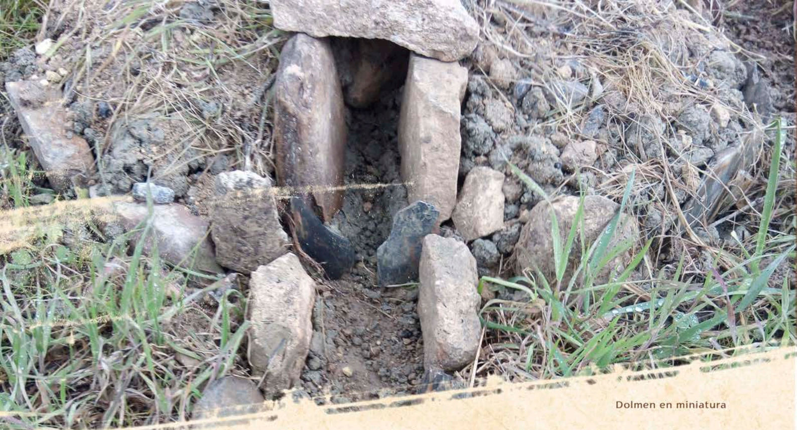
Dolmen en miniatura