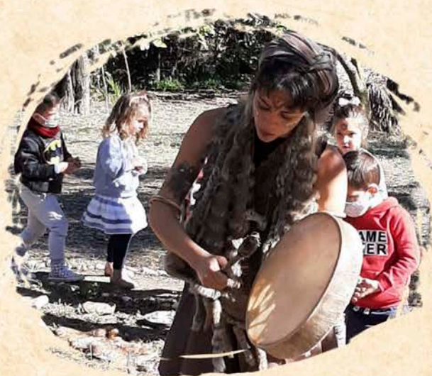
Shetaá con los pequeños