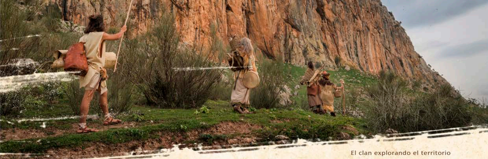
El clan explorando el territorio