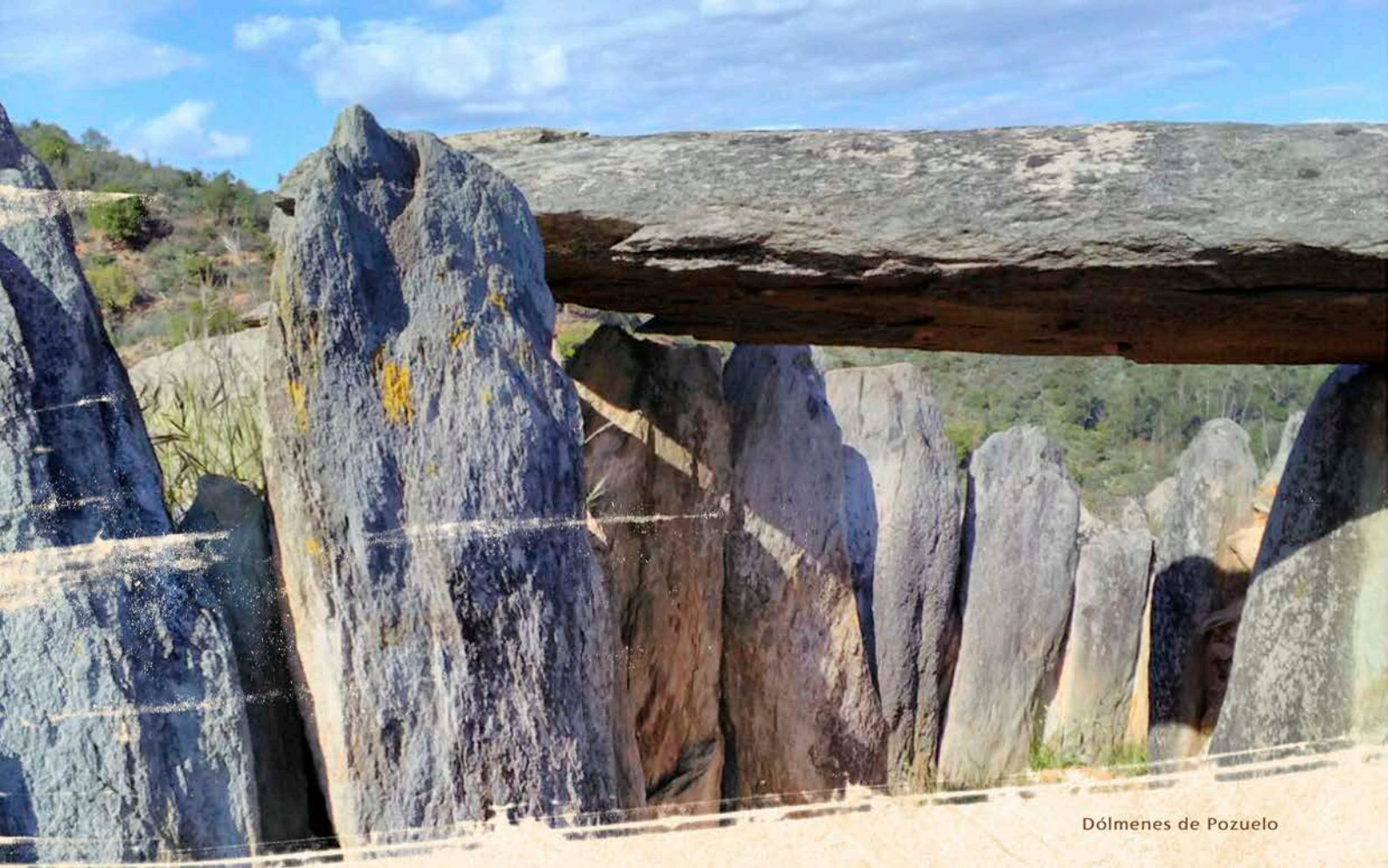
Dólmenes de Pozuelo