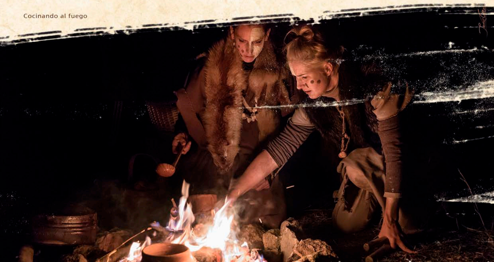
Cocinando al fuego