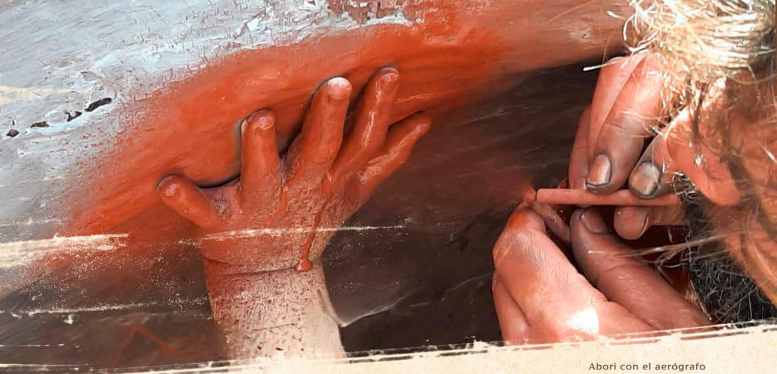
Abori con el aerógrafo