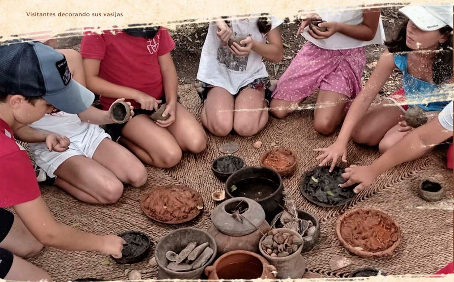
Visitantes decorando sus vasijas

De la propia tierra arcillosa que pisamos en nuestros campos obtenemos la materia prima para convertirla con nuestras manos en recipientes que nos sirvan para guardar los alimentos y el agua. Cada participante realizará una pieza de cerámica (Vasija) siguiendo la técnica prehistórica local, que se llevará de recuerdo. Aprenderá la importancia del descubrimiento de la cerámica para la vida cotidiana del ser humano y agradecerá a la madre naturaleza por los materiales que nos proporciona. Contamos con horno rudimentario para mostrarles todo el proceso.