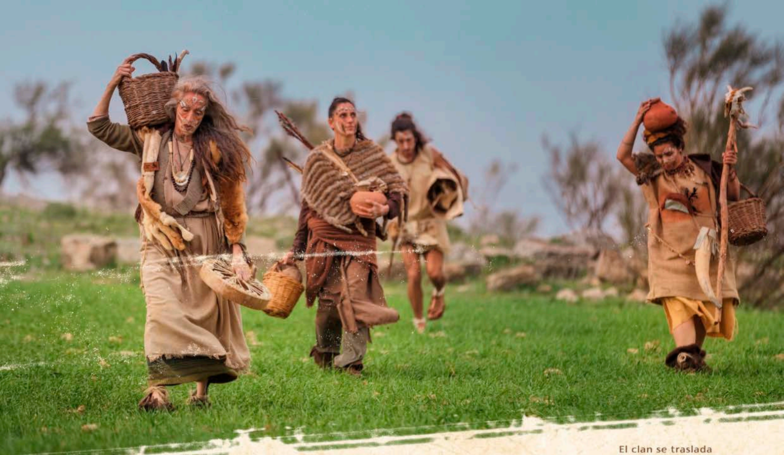
El clan se traslada