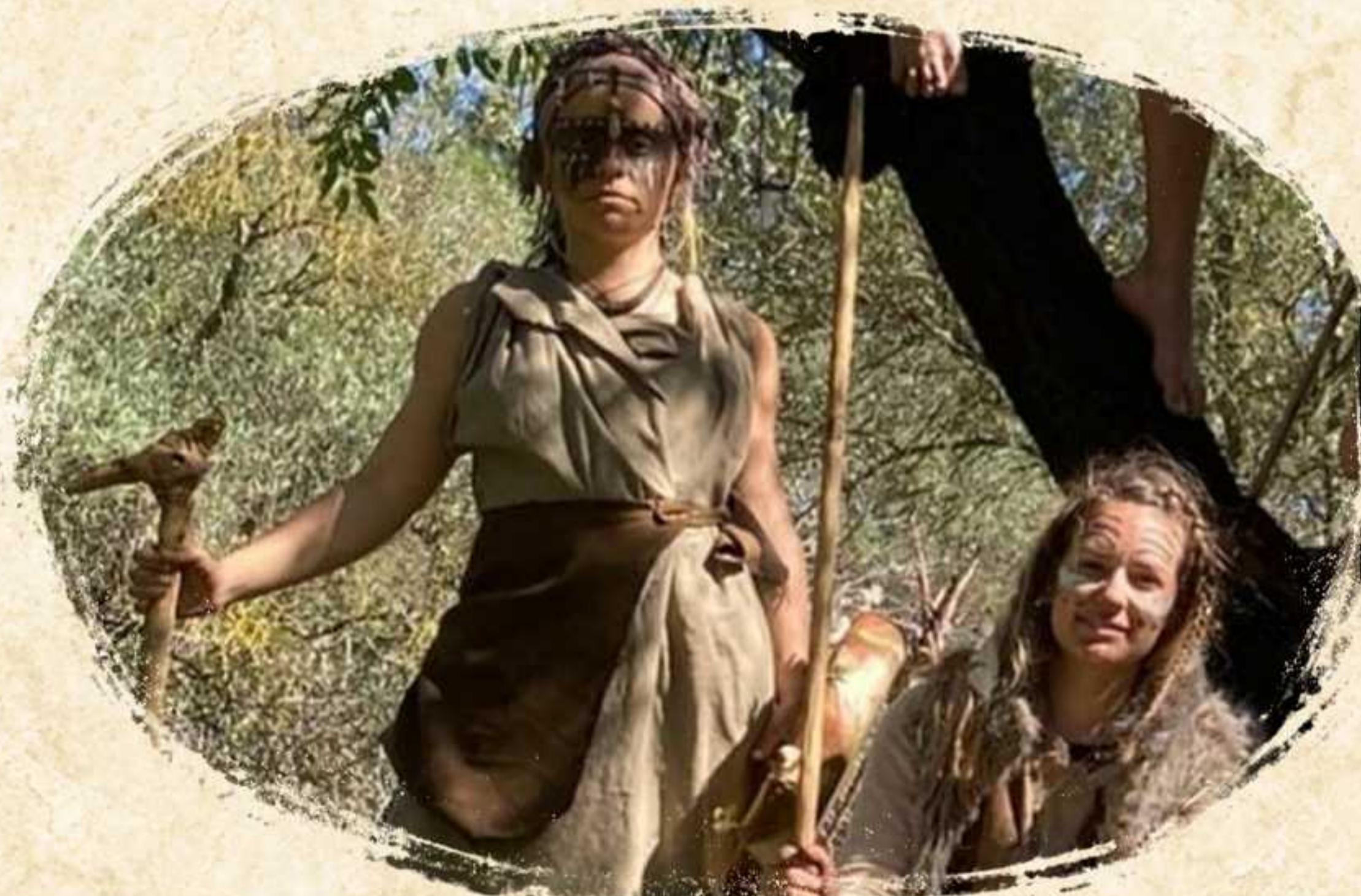
MAYAHUÉ Y MALANA