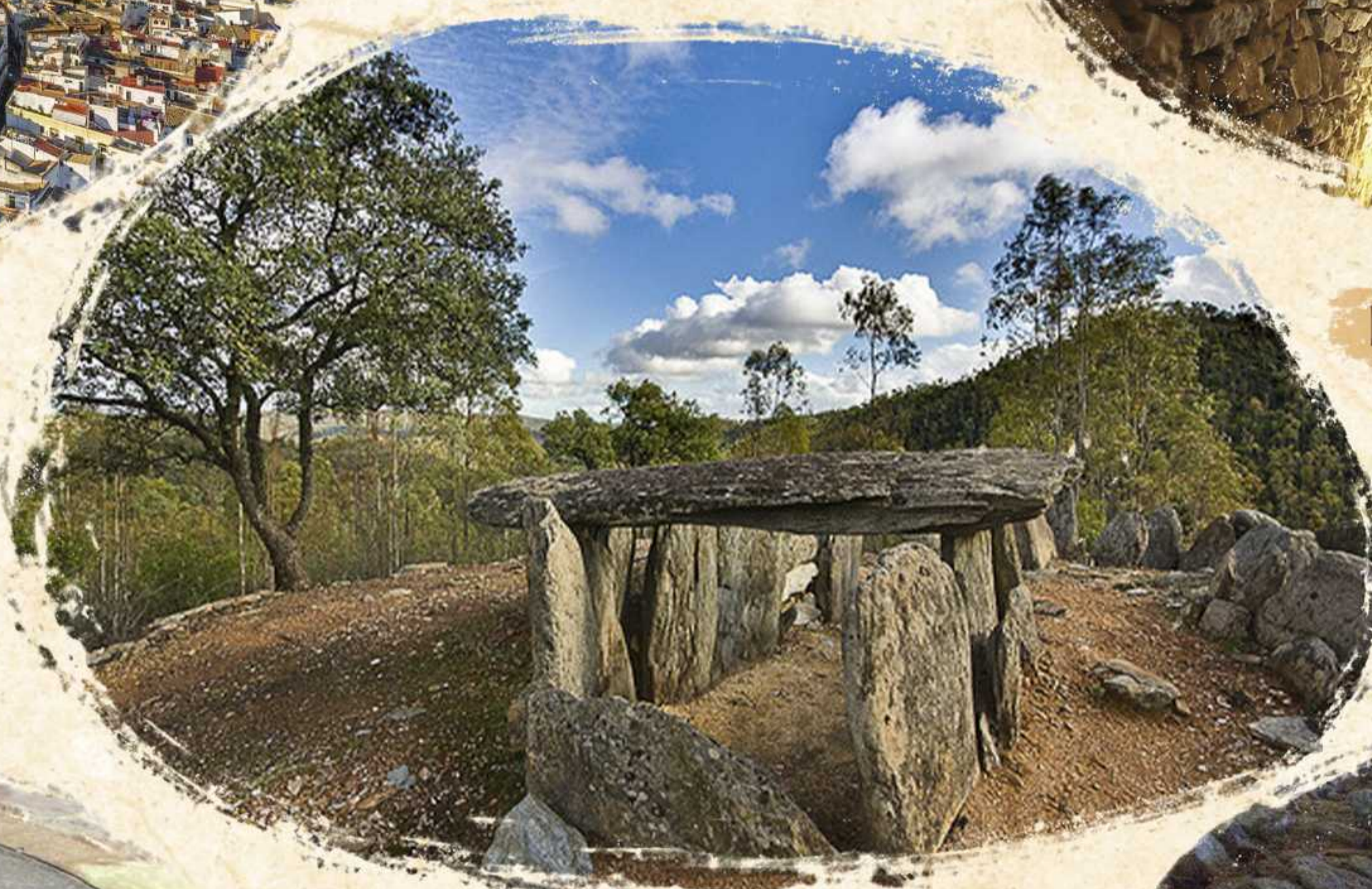
Dólmenes de El Pozuelo