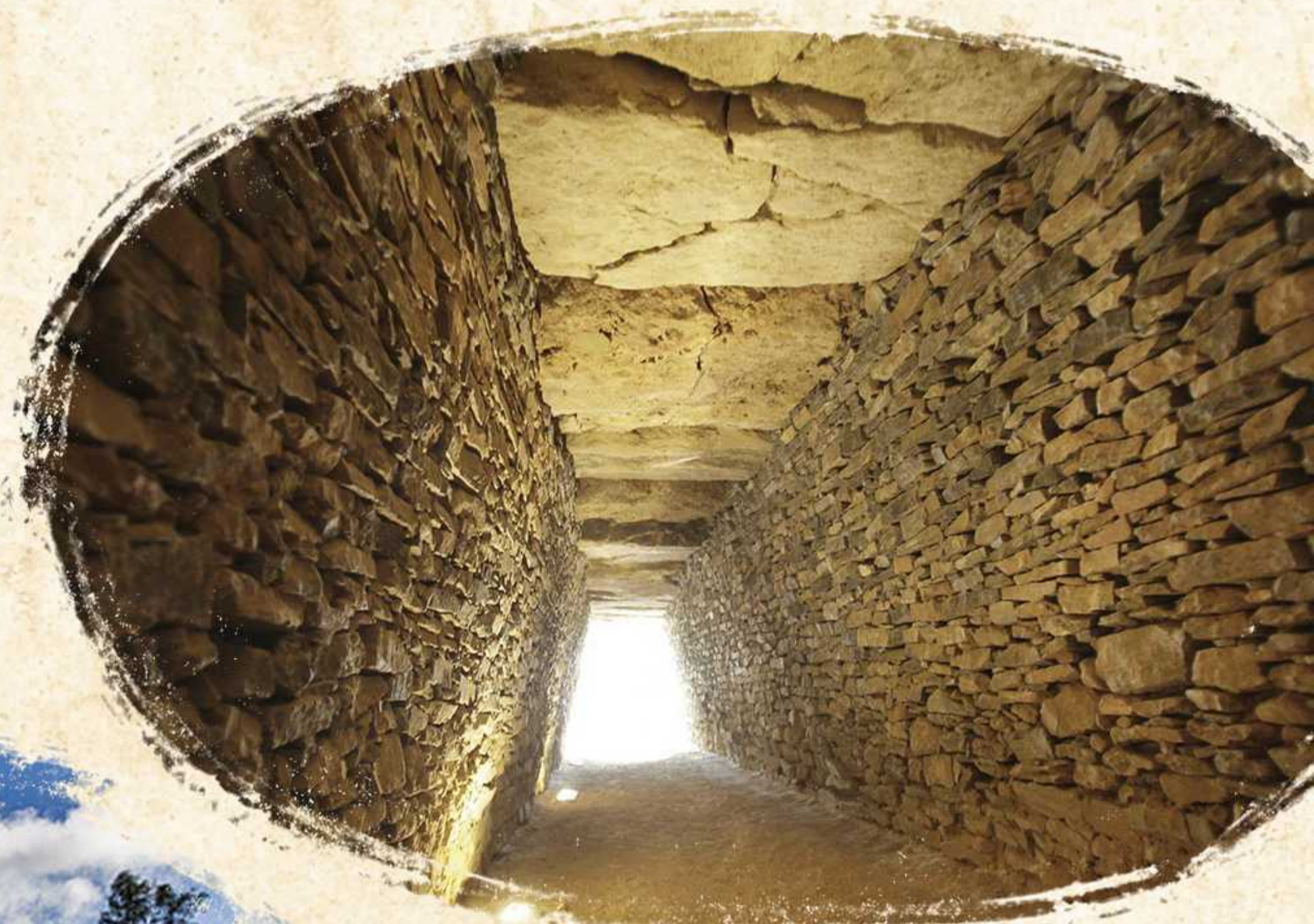
Dolmen de La Pastora