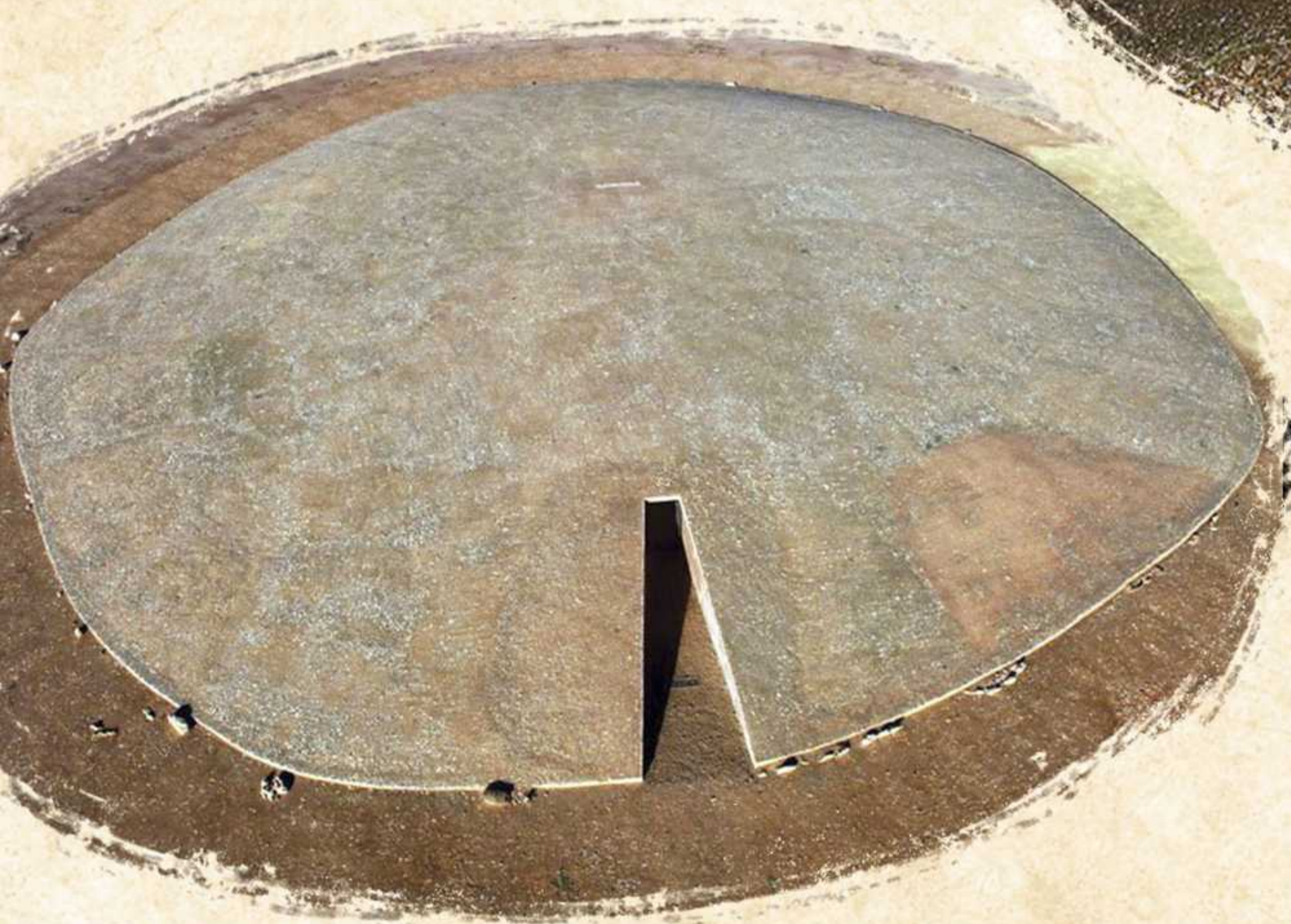
Dolmen de Soto