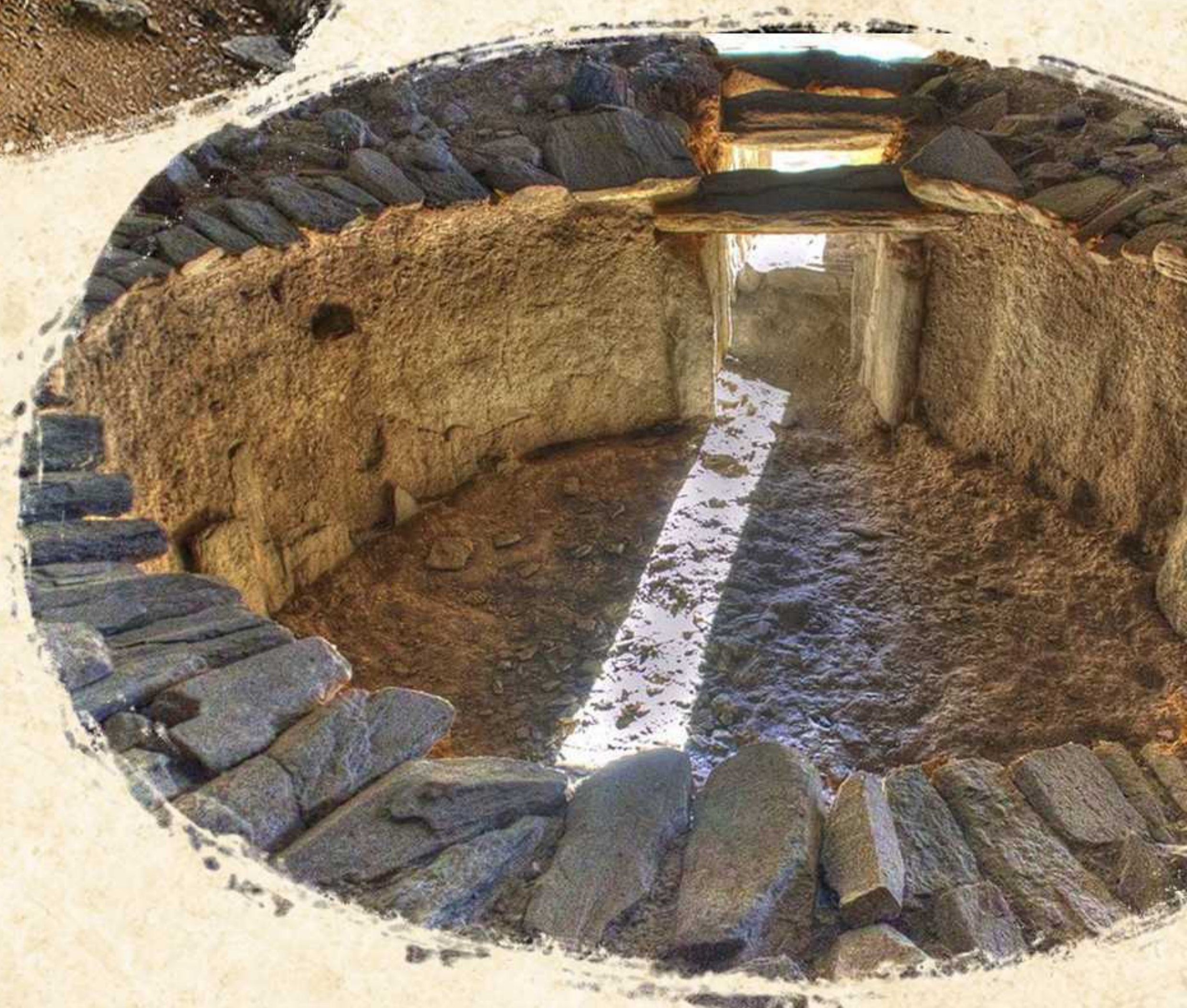
Sepulcro Huerta Montero